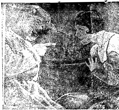
Will Rogers, in his new Fox comedy, "Young As You Feel," points out to Fifi Dorsay that he, too, has some young ideas.

Fifi Dorsay Will Rogers a linda francezinha que o formidável comico que a tem nos olhos a vibração critica americana considerou romantica de Paris... ent e os melho es