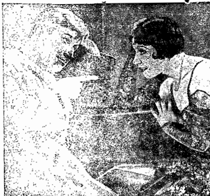
Will Rogers, in his new Fox comedy, "Young As You Feel," points out to Fifi Dorsay that he, too, has some young ideas.

Fifi Dorsay Will Rogers a Linda francesinha que o formidavel comico que a tem nos olhos a vibração critica americana considerou romantica de Paris. ent e os melhores