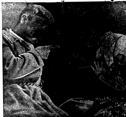
Will Rogers, in his new Fox comedy, "Young de You Fool" points out to Fifi Dorsay that he, too, has some young ideas.

Fifi Dorsay Will Rogers a Inda francesa que o formidavel comico que a tem nos olhos a vibraçao critica americana com ideias romantica de Paris. Entre os melhores