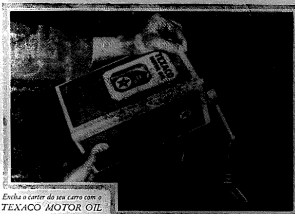
Encha o carter do seu carro com o TEXACO MOTOR OIL

SE o carter do seu carro estiver cheio de TEXACO MOTOR OIL o funcionamento do motor será melhor sob quaesquer condições.