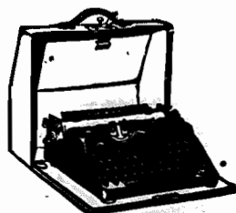
MACHINAS DE ESCRIVER, PORTATEIS E PARA ESCRITORIOS