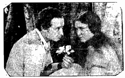
Raquel Torres e Monte Blue

Musicas e canções do outono e inverno Fotografias admiráveis - Paisagens formidáveis