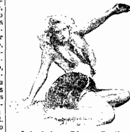
A tentadora Edwina Booth

Trader Horn será sem duvida a mais sensacional estrea da Metro Goldwyn-Mayer nesla temporada.