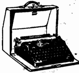
MÁQUINAS DE ESCREVER, PORTÁTEIS E PARA ESCRITÓRIOS