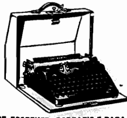
MACHINAS DE ESCREVER, PORTATIS E PARA ESCRITORIOS