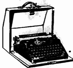
MACHINAS DE ESCREVER, PORTATIS E PARA ESCRITORIOS