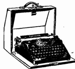
MACHINAS DE ESREVER, PORTATIS E PARA ESCRIT. DOS