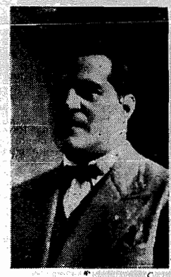
Dr. Batista Luzardo

E o pacto secreto, pouco depois divulgado, de Póços de Caldas? Não dava a impressão totalmente diversa á tua declaração? Não de nada que de ser uma organização civil, de emergência e temporaria para combater um apertado mil