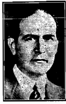
Dr. Osvaldo Aranha

Quando iam mais intensas as «marches» entre os próceres políticos riograndenses e a ditadura, para dermir o dissídio que se cavara entre o Governo Provisório e o Rio Grande—o sr. Batista Luzardo concedeu extensa e sensacional entrevista à imprensa, fazendo acusações ao sr. Osvaldo Aranha. O ministro da Fazenda, sentindo-se atingido pelas declarações do prócer libertador, enviou-lhe uma longa carta, contestando as afirmações feitas.