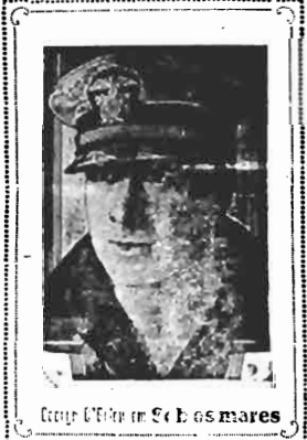
George O'Brien em Sob os mares

Um film extra Sem aumento de preços! 3$000 e 1$500