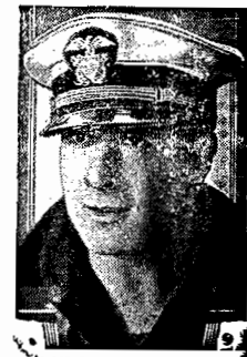
George O'Brien em Sob os mares

UMA EMOCAO EM CADA CENA! Uma batalha naval e uma contenda entre dois seres que se amam