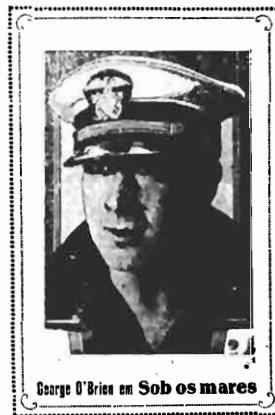
George O'Brien em Sob os mares