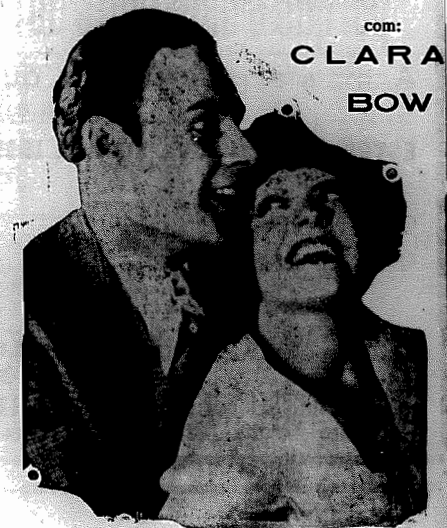
com: CLARA BOW

AMANHÃ - A's 7 e 9 em ponto - AMANHÃ INDICADORA do CINEMA U na joia da PARAMOUNT