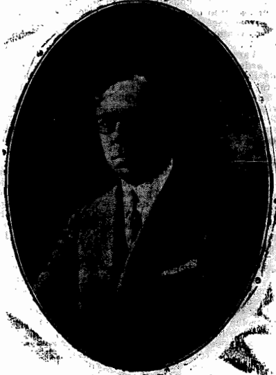
Presidente do Directorio Central do Partido Liberal Catharinense

Não nos surpreende o surto alvorçado de meia-pa-