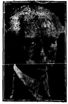
MINISTRO Assis Brasil

da industria, predominaram elementos intellectuaes, solidariedades partidarias, valiosos e respeitaveis interesses sociais. Effectuaram a segunda apenas seus companheiros de anno e contemporaneos de estudo, movimentos simplesmente de impulsos de co-ração. Sexagenarios, septuagenarios alguns, formaram, os componentes desta ultima, uma especie de còro de velhos, como o da opera Fausto, de Gounod, os quaes, á imitação ainda do heróe de Goethe, se sentiram ali rejuvenescidos por um elixir mágico — o das saudosas recordações. Na primeira manifestação, foi saudado Assis Brasil, e os aspectos de estadista, plenipotenciario no estrangeiro, tribuno, autor de preciosos livros, sementeiro de idéas, conductor de homens e de correntes de opinião. Na segunda, como excellent camarada, fiel amigo, inspirador de affectos e carinhos fraternaeas.