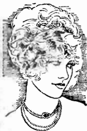
ESTHER RALSTON IN PARAMOUNT PICTURES

A vida romantica de Lená Smith encerra em si tudo quanto pode conter de mais nobre o coração de uma mulher. O sublime amor de mãe não podia encontrar nas figuras das nobres patricias romanas, que se celebrisaram pelo amor a seus filhos, um simbolo mais perfeito do que Lena nos apresenta.