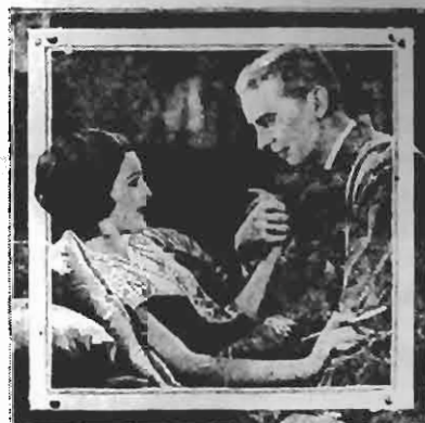
Mary Astor and Matt Moore in 'Dry Martini' Fox Picture