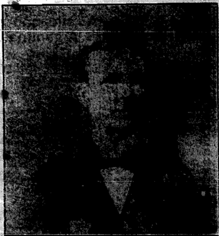
Presidente do Estado