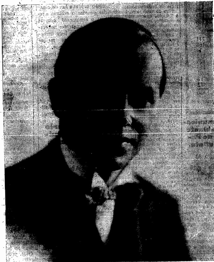
Candidato á Senatoria

Como não lhe prestarmos nós, catharinenses, a nossa justiceira homenagem, pelo voto livre, unidos, conscientes, no momento em que se nos apresenta uma oportunidade em relevo, fixando um momento notavel da nossa historia politica?