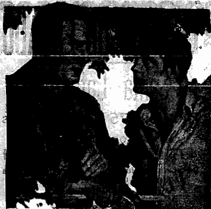
Janet Linow and Charles Farrell in "The River," Fox Picture

Amanhã -Soirée Chic - As 7 e 8 1/2 em ponto - Amanhã