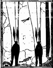
STYLE 1515 "DOUBLE DIAMOND"

Rosaine Hosiery A ultima criação de Nova York