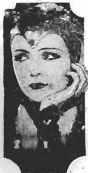
Mary Astor in The Woman From Hell Fox Picture

A FOX FILM apresenta hoje um drama todo especial e bellissimamente montado