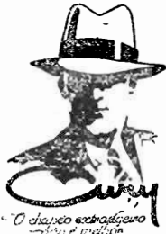
O chapéu esportivo — a moda e a elegância

Vêde e use os elegante chapéus Cury A unica recebedora e vendedora deste afamado artigo, nesta capital, é a CHAPELARIA XAVIER à rua Tiradentes — Florianópolis Preços reduzidos