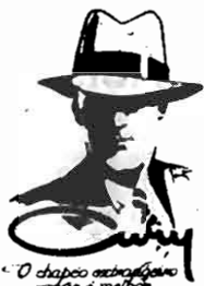
"O chapéu se sobrepõe ao rosto e ao cabelo"