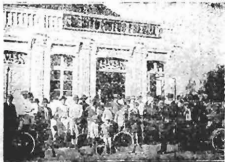
Séde da Filial do "Credito" em Joinville