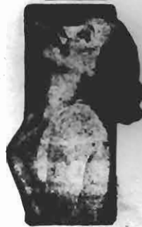
Lola Salvi Mastered in Paris Fox Picture