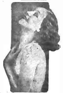
Lola Salvi. Mastered in Paris. Fox Picture