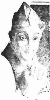
Sammy Cohen "Plastered in Paris" Fox Picture