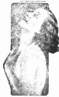
Lola Salvi in "Plastered in Paris" Fox Picture