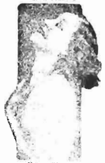
Lola Salvi "Plastered in Paris" Fox Picture