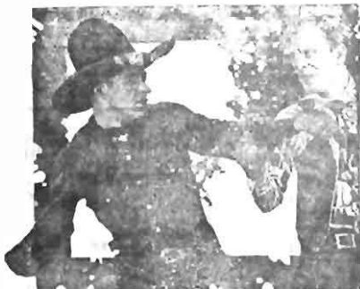
Rex Bell in a scene from "The Cunt-Shy Cowboy" Fox Picture