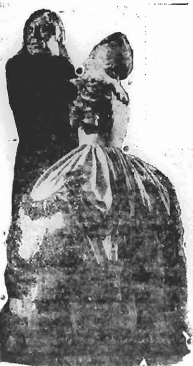
A maior satyra contra a hypocrisia humana.