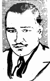
WALLACE BEERY IN PARAMOUNT PICTURES

PARAMOUNT NEWES N. 39 -- FILM NATURAL EM I PARTE