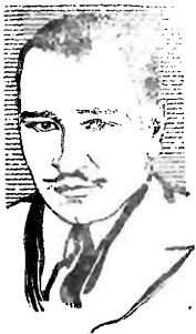
WALLACE BEERY IN PARAMOUNT PICTURES