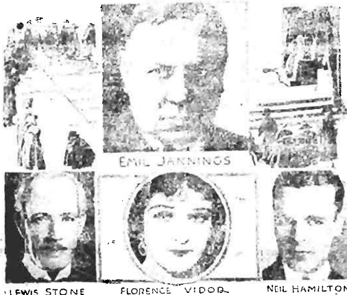
LEWIS STONE FLORENCE VIDOR NEIL HAMILTON