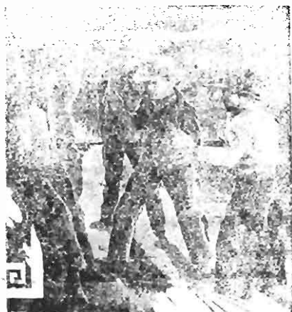
A scene from Wild West Romance. Rex Bell