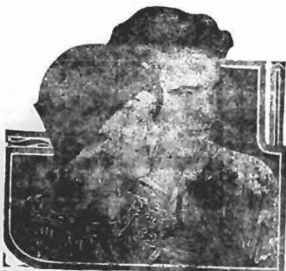
Lois Moran, Nick Stuart, Victor McLaglen, Earle Foxe in THE RIVER PIRATE, A FOX PICTURE