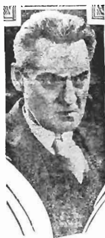
Lionel Barrymore in "Road House", Fox Picture

com: VICTOR MC LAGLEN, LOUIS MORAN E NICK STUART. - Mais um film de successo.