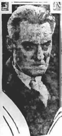
Lionel Barrymore 4a. Road House, Fox Picture