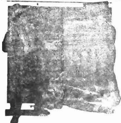
Scene from 'The Cowboy Kid,' Fox Picture