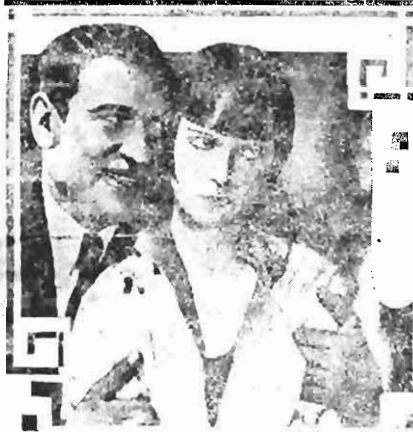
Victor Mc Laglen & Louise Brooks in A Girl in Every Port - Fox Picture