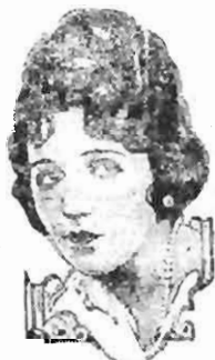
BEBE DANIELS starring in Paramount Pictures