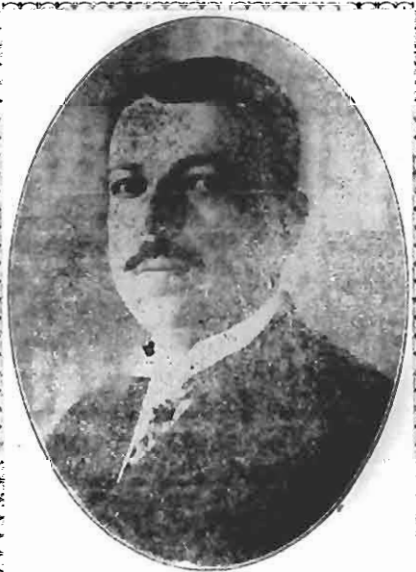
Presidente Julio Prestes

Ainda agora, o nosso glorioso partido cumpre, com dignidade e elevação, o seu dever, formando ao