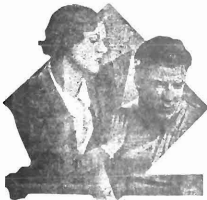
June Collyer and Don Terry in "ME, GANGSTER" FOX PICTURE

Breve Breve Breve A Hygiene do Casamento premiado pelo governo allman e dirigido pelos maiores scientificos das universidades de VIENNE e de BERLIM. UM CRITO DE ALARME AOS CASADOS. UML. ADVERTENCIA AOS SOLTEIROS. E' o film que todos os noivos, casados e solteiros precisam ver! O amor não é apenas romantismo e poesia! Não é apenas sonhos e ilusão! Ha questoes physiologicas e maternas que todos tem obrigação de conhecer! O FILM QUE BATEU O RECORD DE ENCHENTES E EXHIBIÇÕES NO RIO E SAO PAULO. (Improprio para menores e senhoritas).