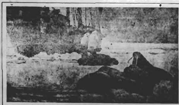
Scene from "Lost in the Arctic", Fox Release

nos conta uma historia, simples, mas commovente, de acção intensa, de uma creatura que ao nascer morrera-lhe a mãe, e torna-se uma filha de ninguém, creada entre outras duas creaturas da aristocracia. --- OS TRES FILHOS DE NINGUEM, é mais um film da UFA que o Programma Urania distribue.