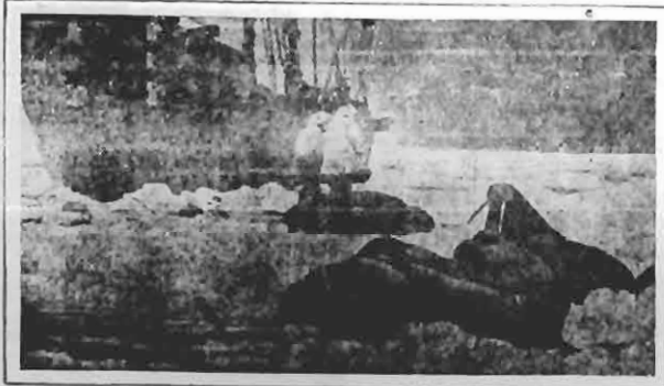
Scene from "Lost in the Arctic," Fox Picture

UMA NOVA PHASE DA ARTE MUDA, INICIADA PELA FOX.