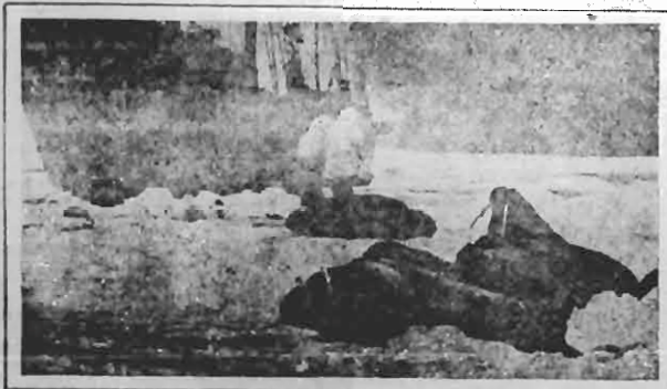
Scene from "Lost in the Arctic" Fox Picture

UMA NOVA PHASE DA ARTE MUDA, INICIADA PELA FOX.