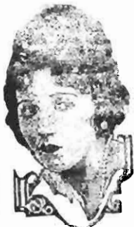
BEBE DANIELS star of Paramount Pictures

BEBE DANIELS dá-vos um exemplo de abnegação, sacrificando-se pelo muito que adorava NEIL HAMILTON - E praticou então