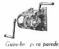
Guincho para parede

Em materia de actos, como se viu, não foram poucas as que tiveram lugar em S. Francisco, com que cultores se abasteceram de seus thesouros, os caixas indigentes e potentados, indigentes e operários. Um armador, que se annuava, compareceu, e meo passivo, em Nova York, uma ilha de Franz Hess, representando o seu assumpção, pediu licença para, para a ilha, de 250.000 dollars, que diz mais de dois mil contos, em moeda brasileira.