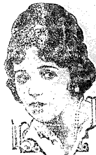
BEBE DANIELS de orgão Paramount Pictures

Segunda Sessão - Às 8 horas em ponto - Preços - 15$000 3$000 $600