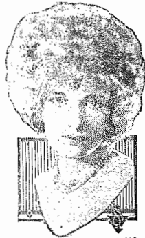
ESTHER RALSTON IN PARAMOUNT PICTURES

Sessão Chic - Às 8 horas em ponto Preços---Friza 10$000 Platéa 2$000 Geral $600 Casamento a prazo fixo