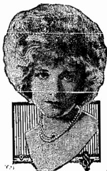
ESTHER RALSTON IN PARAMOUNT PICTURES

Com: ESTHER RALSTON e GARRY COOPER. Um film da "Paramount".