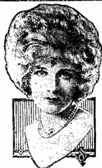
ESTHER RALSTON IN PARAMOUNT PICTURES

ESTHER RALSTON, a loura e bella artista da PARAMOUNT -- A "Venus Americana" e GARY COOPER -- appareem em uma interessante e magnifica interpretação em o bello film: